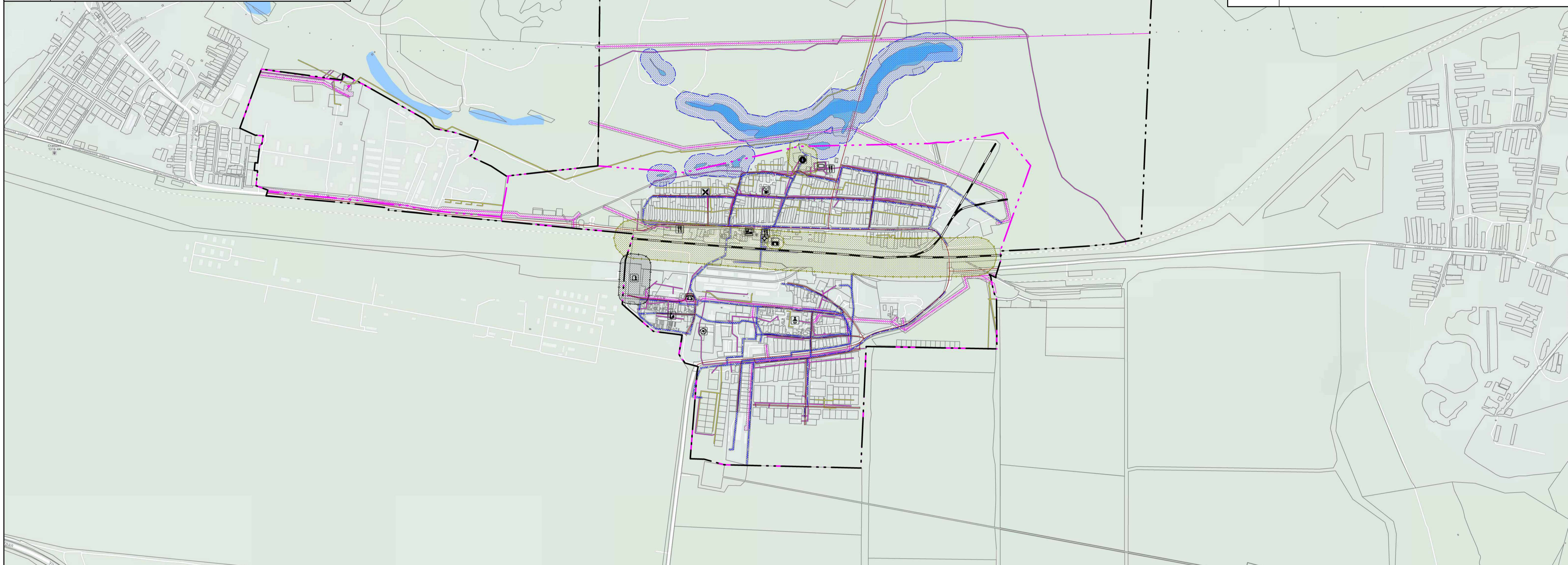
Фрагмент (п.Городок Третий) М 1:5 000